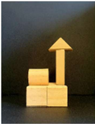
Vue côté vert