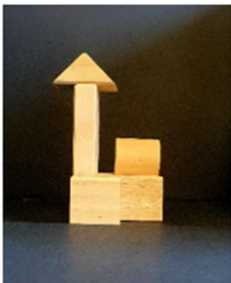
Vue côté rouge