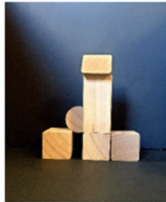
Vue côté bleu