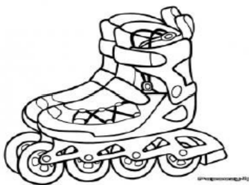
Patins à roulettes