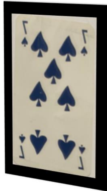
Son reflet dans le miroir

Analyse/ repérage des éléments non symétriques dans les autres cartes.